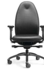
TANGO TG 24